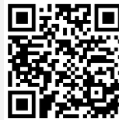
คู่มือการใช้งาน e-Voting

*หมายเหตุ การทำงานของระบบประชุมผ่านสื่ออิเล็กทรอนิกส์ และระบบ Inventech Connect ขึ้นอยู่กับระบบอินเทอร์เน็ตที่รองรับของผู้ถือหุ้นหรือผู้รับมอบฉันทะ รวมถึงอุปกรณ์ และ/หรือ โปรแกรมของอุปกรณ์ กรุณาใช้อุปกรณ์ และ/หรือโปรแกรมดังต่อไปนี้ในการใช้งานระบบ